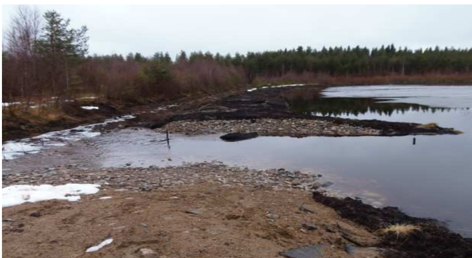
Patovalliin rakennettiin leveä pohjapato, mikä mahdollistaa tulva-aikaisen juoksutuksen pohjapadon kautta. huhtikuu 2013