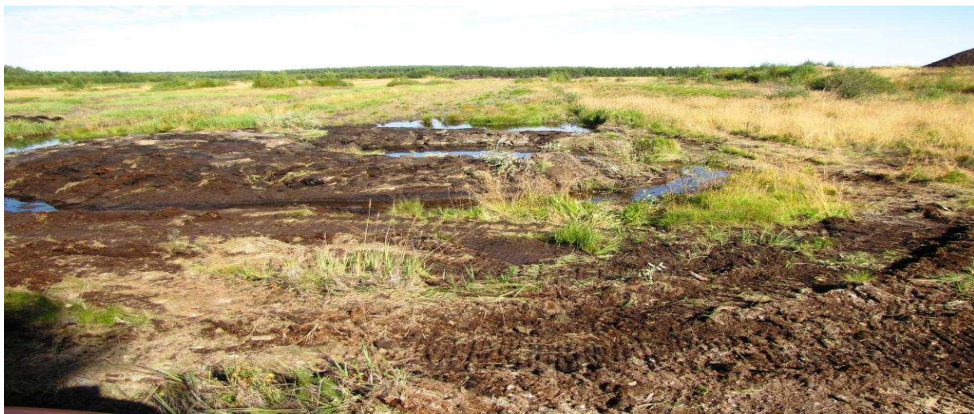
Ennen kosteikon perustamista alue oli kuivaa kasvuston peittämää, vesilinnuille sopimatonta aluetta.

Peräneva on vanhaa turvetuotantoaluetta, jossa toiminta loppui vuoden 2005 aikana. Turvetuotannon loputtua alue on ollut luonnontilassa ja keväisin tulva-aikaan alueella levähtää suuri määrä vesilintuja ja kahlaajia. Turvetuotannosta poistunut alue oli avo-ojitettu ja valumavedet laskivat suoraan Pääjärven Ruokolahteen ja Laikanlahteen. Peränevan valuma-alue on 376 ha ja se on pääosin ojitettua metsätalousaluetta. Kosteikon suunnittelu Peränevalle aloitettiin Karstulan kunnan aloitteesta, kun se esitti kohdetta yhdeksi Kotiseutukosteikko LIFE + -hankkeen mallikohteeksi.