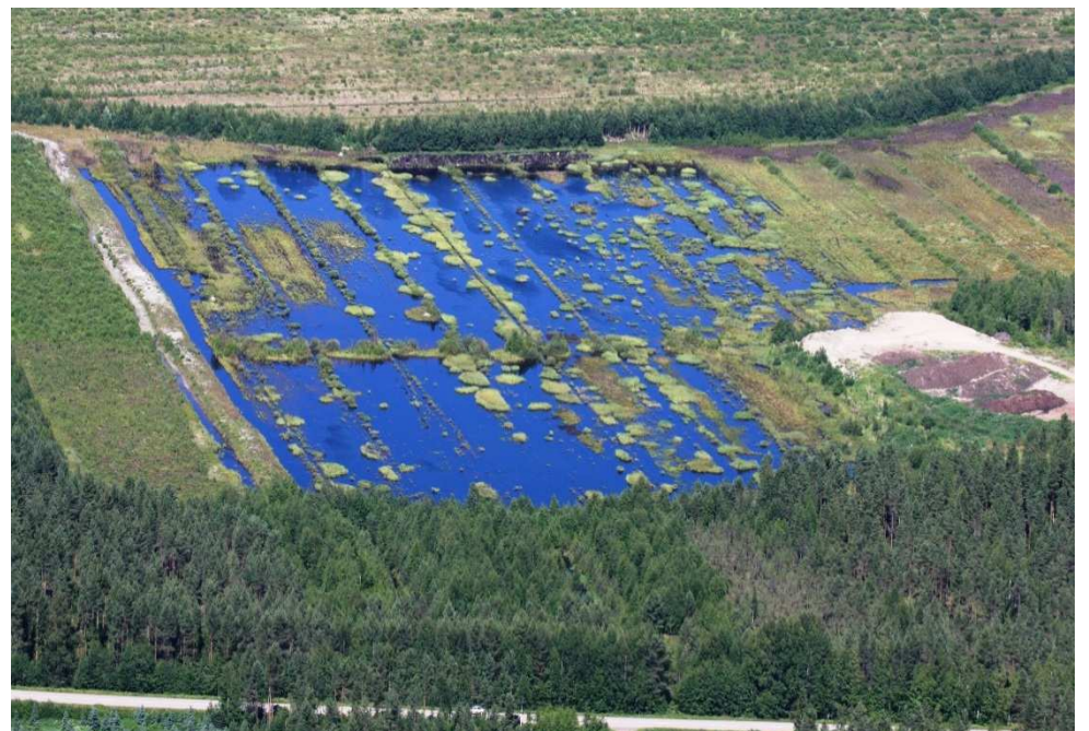
Valmiina kosteikkona käytöstä poistunut turvetuotantoalue on hyvä lisääntymisympäristö vesilinnuille ja muille kosteikkolajeille.