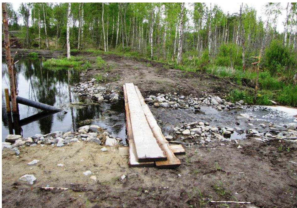
Kosteikon vedenpintaa nostettiin padottamalla laskevaa puroa.