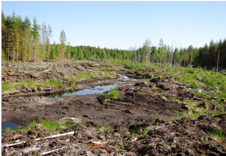
Avovesialueet tehtiin kaivamalla talvella 2013. 3.6.2013

Ruohosuon kosteikon tavoitteena on edistää luonnon monimuotoisuutta sekä lisätä vesilintujen lisääntymis- ja levähdysalueita tuottamalla matalaa avovesialuetta.