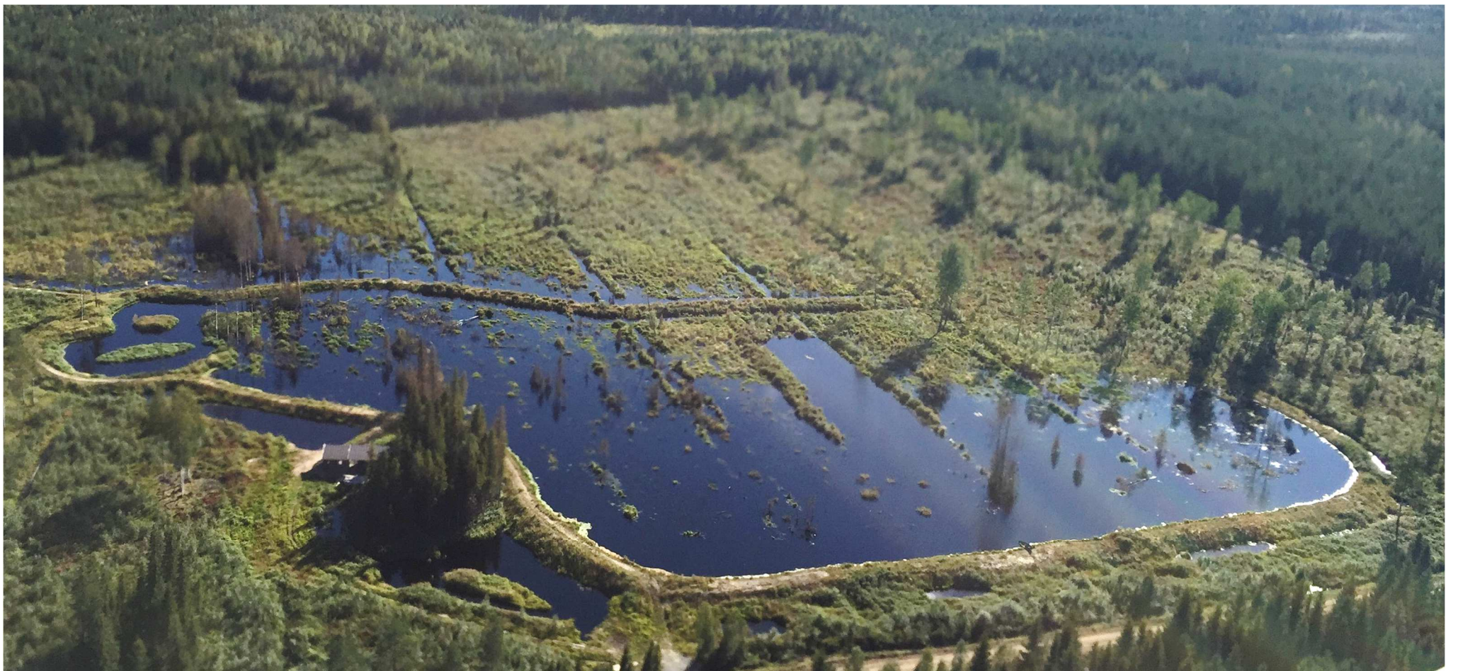
Mustapuron kosteikolla on kaksi osa-alueita, joilla on eri vedenpinnan taso.