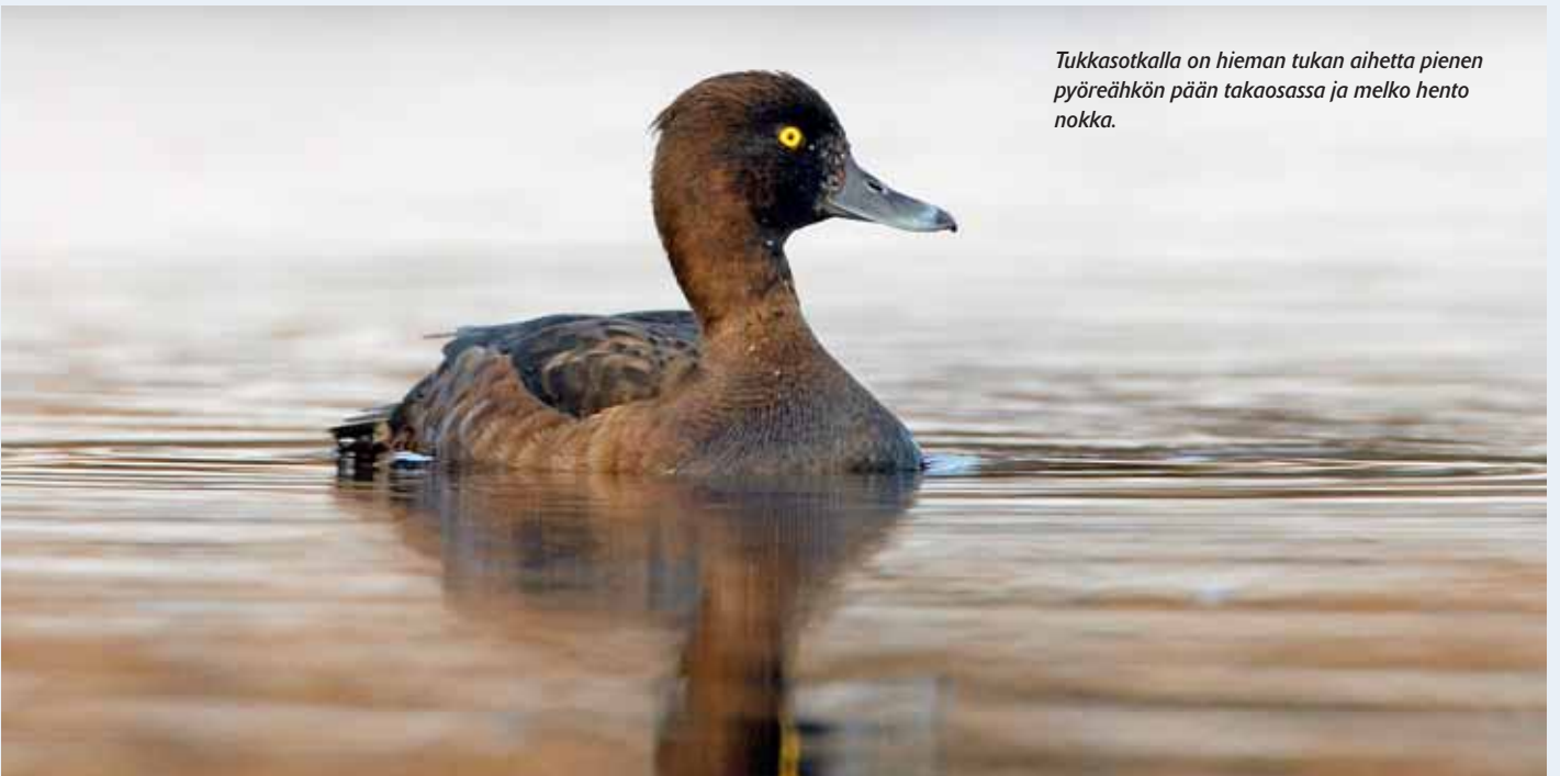
Tukkasotkalla on hieman tukan aihetta pienen pyöreähkön pään takaosassa ja melko hento nokka.