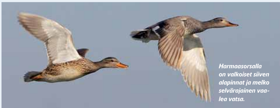
Harmaasorsalla on valkoiset siiven alapinnat ja melko selvärajainen vaalea vatsa.

Sotkalajeista punasotka on Etelä-Suomessa yleinen ja tukkasotka on koko maassa runsaslukuinen. Tukkasotkaa suuresti muistuttava lapasotka on sen sijaan rauhoitettu. Lapasotkaa tavataan maassamme harvinaisena pesijänä rannikolla ja Pohjois-Suomen järvillä, mutta myöhemmin syksyllä se on melko tavallinen läpimuuttaja koko maassa sekä sisävesillä että rannikoilla. Punasotka on helppo erottaa kahdesta muusta sotkasta harmaan siipijuovansa perusteella, mutta tukka- ja lapasotka muistuttavat suuresti toisiaan, sillä niillä on kummallakin leveät valkoiset siipijuovat läpi koko siiven. Lapasotka on kuitenkin hieman tukkasotkaa