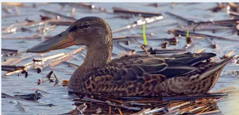
Lapasorsalla on tunnusomaisen suurikokoinen nokka, joka tekee koko linnusta etupainoisena.