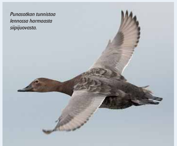
Punasotkan tunnistaa lennossa harmaasta siipijuovasta.

Sähköinen materiaali sorsien tunnistukseen elokuussa osoitteessa www.riista.fi .