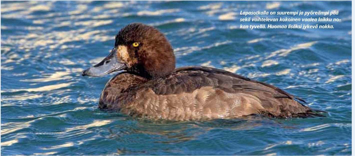
Lapasotkalla on suurempi ja pyöreämpi pää sekä vaihtelevan kokoinen vaalea laikku nokan tyvellä. Huomaa lisäksi jyrkvä nokka.