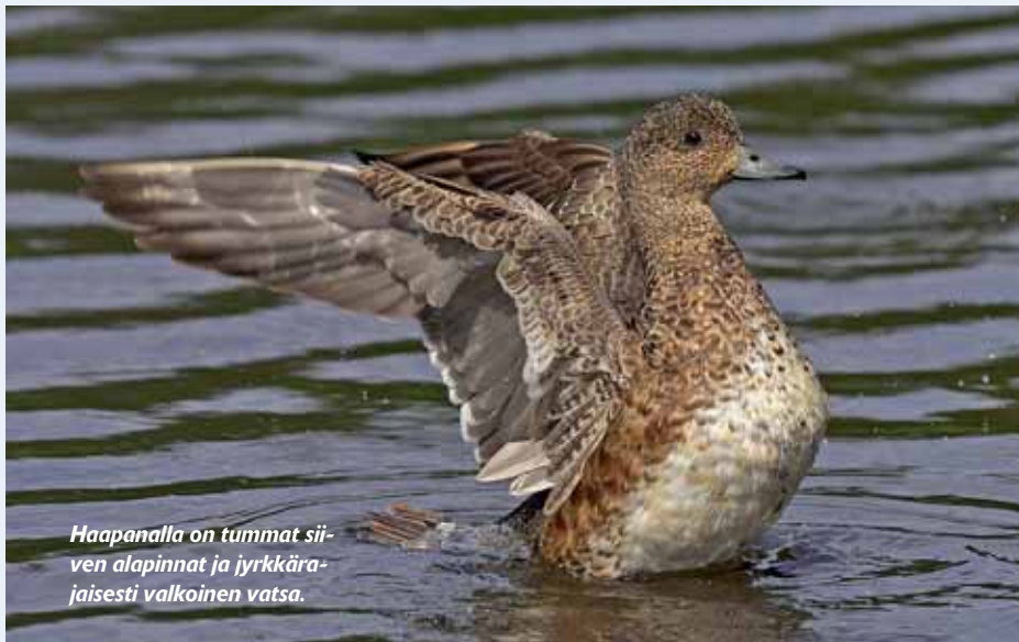
Haapanalla on tummat siiven alapinnat ja jyrkkärajaisesti valkoinen vatsa.