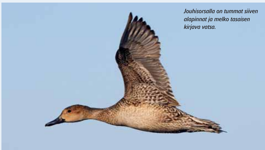
Jouhisorsalla on tummat siiven alapinnat ja melko tasainen kirjava vatsa.