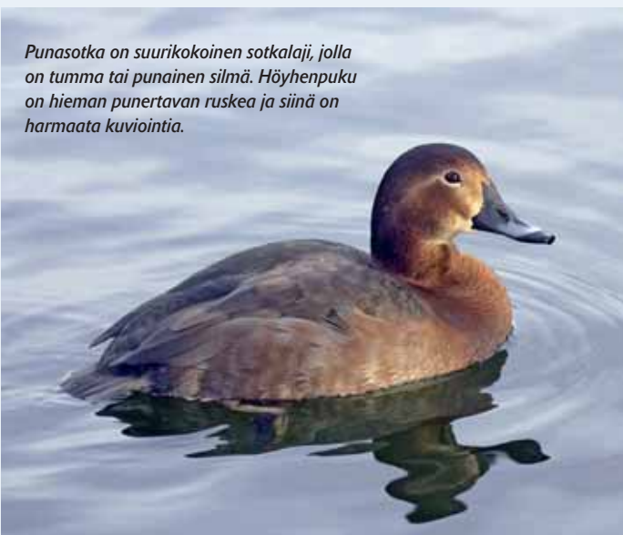
Punasotka on suurikokoinen sotkalaji, jolla on tumma tai punainen silmä. Höyhenpuku on hieman punertavan ruskea ja siinä on harmaata kuviointia.